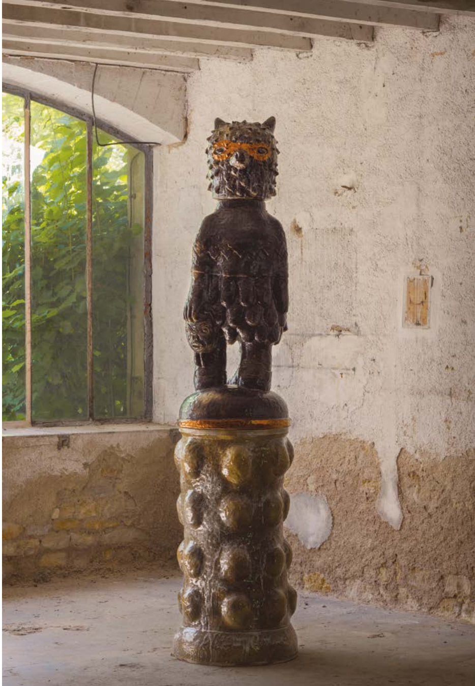
LE RENARD MASQUÉ , 2023 Grès émaillé – 50 x 50 x 200 cm