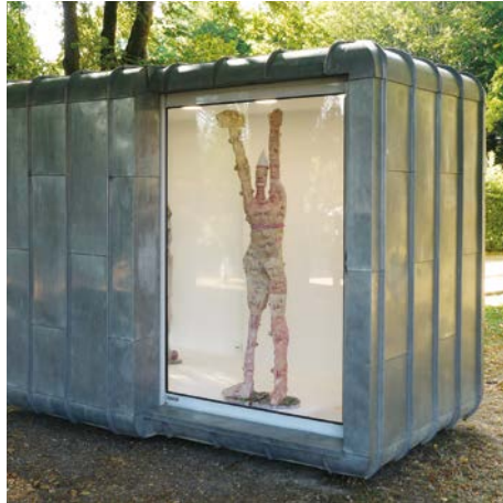
La borne à La Borne (septembre 2019)