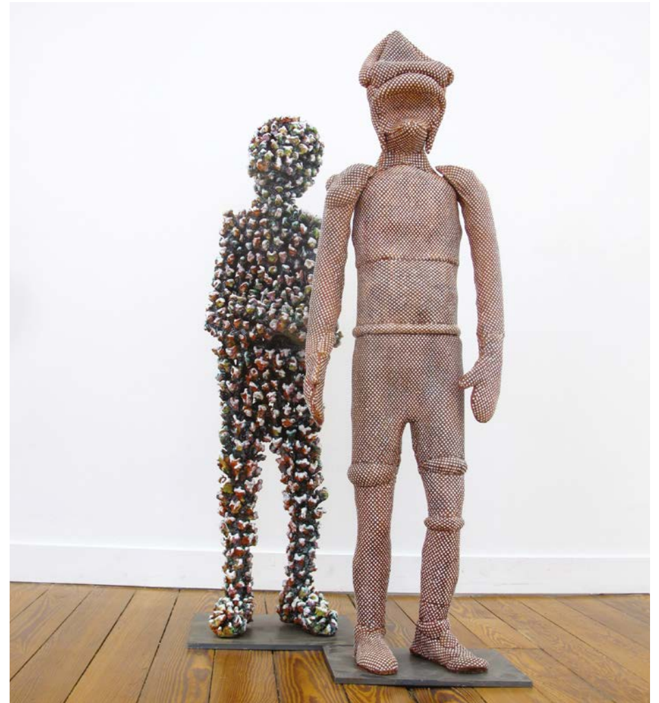
L'OMBRE , 2014 Céramique émaillée – 43 x 30 x 116 cm