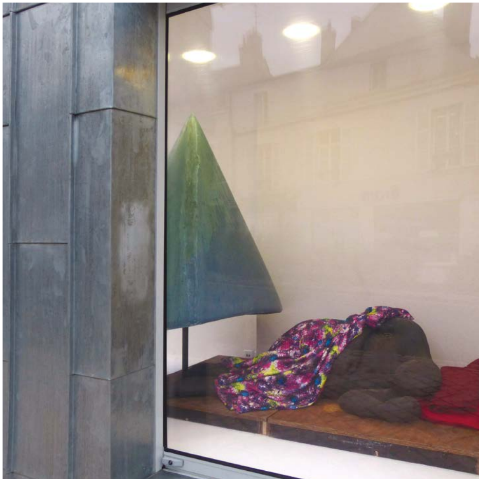
La borne à Beaugency (Février 2016)