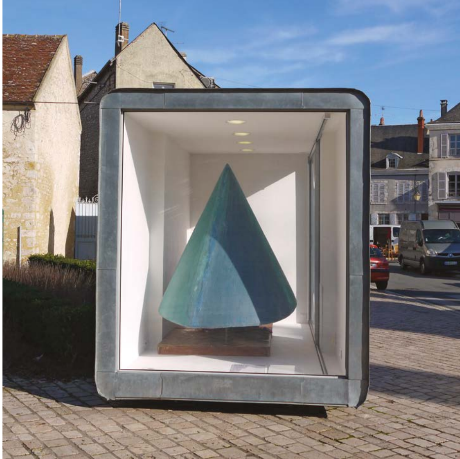
La borne à Beaugency (Février 2016)