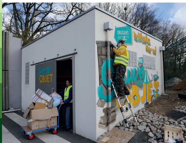
Le local du réemploi a été customisé par le graffeur de Pschitt Déco.

Dans le cadre de la gestion des déchets, Orléans Métropole a mis en place, à la déchetterie de Saran, ce que l'on appelle un local de réemploi. Il permet à toute personne qui le souhaite d'apporter un objet dont elle n'a plus aucune utilité pour lui redonner une seconde vie.