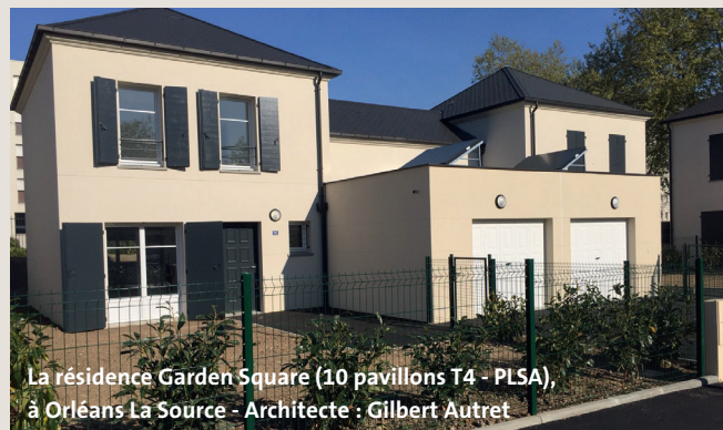
La résidence Garden Square (10 pavillons T4 - PLSA), à Orléans La Source - Architecte : Gilbert Autret