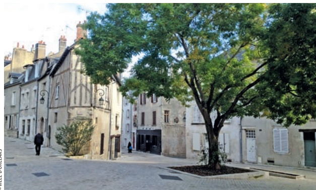
La requalification du secteur Bourgogne Est s'inscrit dans la même veine et vise un niveau de qualité équivalent à celui du cœur de ville.