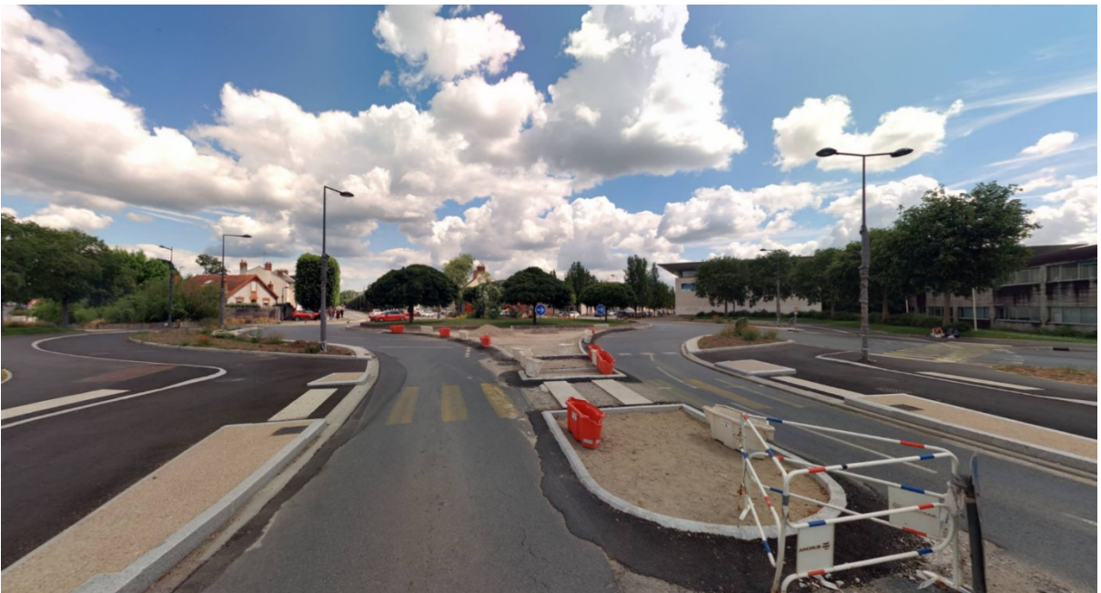
Fig.2 - Aménagement du rond-point Candolle fin 2023 - début 2024

Sur le plan des infrastructures cyclables, les opérations de requalification de voirie intègrent désormais de manière quasi systématique des aménagements dédiés aux mobilités douces, adaptés à leur contexte urbain et leur trafic. Environ 20 % du coût de ces opérations est en moyenne dévolu aux mobilités douces et représente un effort de la Métropole d'environ 3,15 M€ en 2023.