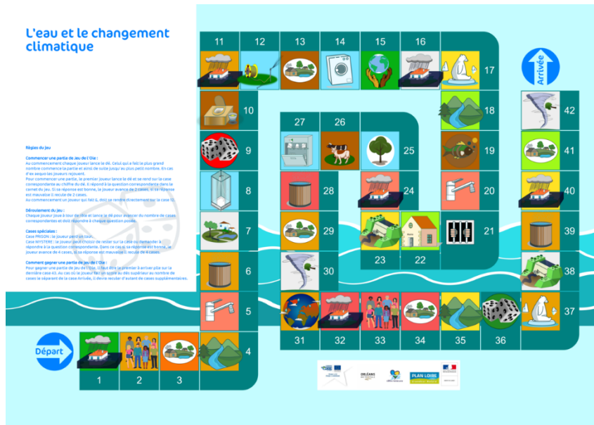
Plateau du jeu de l'Oie sur l'eau

2023 a vu la mise en œuvre de la dernière année du premier Programme d'Actions pour la Prévention des Inondations (PAPI d'intention), comparable à un programme d'études préalables pour la période 2020 à 2023. Ce programme a pour vocation de promouvoir une gestion intégrée des risques d'inondation, afin de réduire les conséquences sur la santé humaine, les biens, les activités économiques et l'environnement.