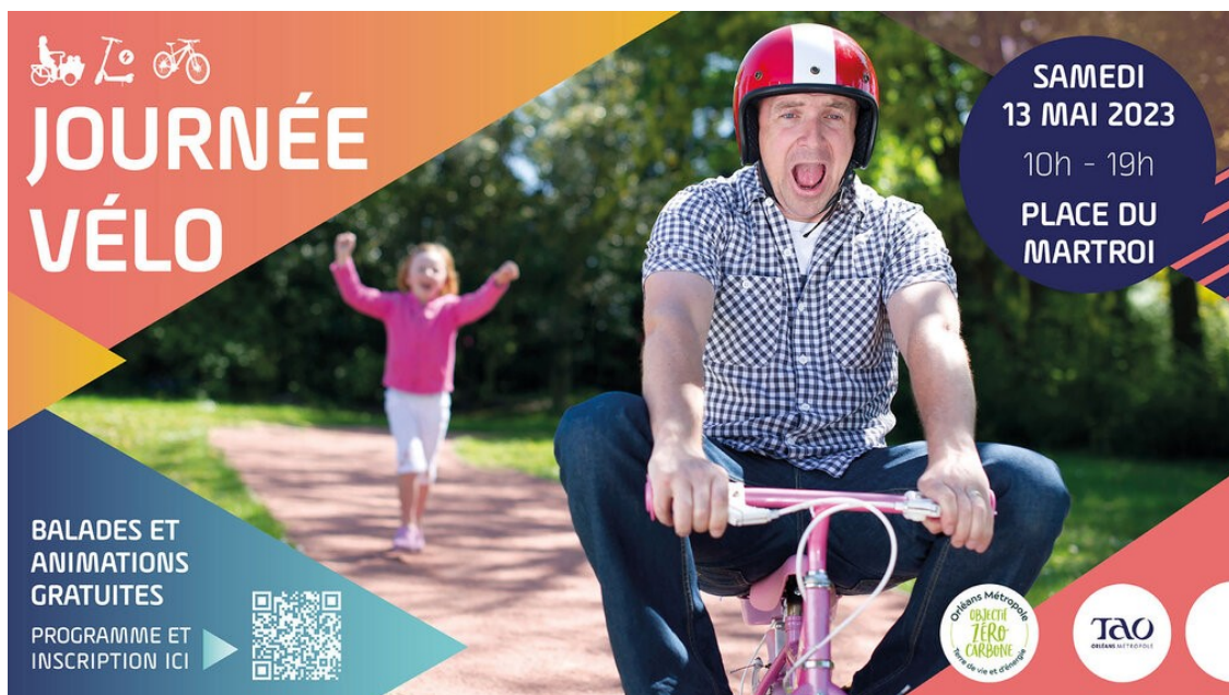
Fig.1 - Visuel de communication « journée vélo »

Le 13 mai, Orléans Métropole a organisé une journée dédiée à la pratique du vélo et de toutes les mobilités douces (trottinette, roller, bus électrique, etc.). Des conférences, stands, balades, animations, jeux et découvertes ont permis de réunir une diversité de publics et favoriser la pratique du vélo.