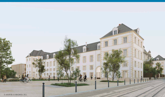
Vue depuis la rue Porte Saint-Jean

En parallèle, début 2025 sera marqué par le début des travaux de construction d'un restaurant du CROUS et de 160 logements.