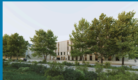
Insertion depuis le boulevard